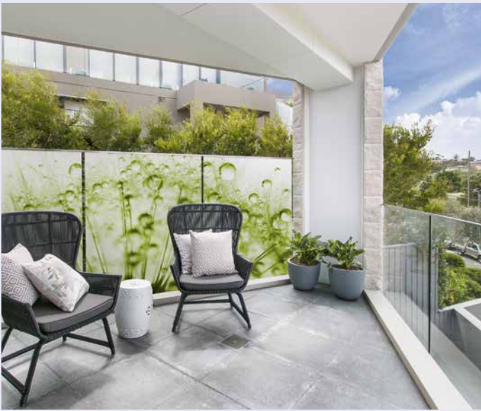
Holen Sie sich mit GEWE®-Di Print Ihren Urlaub nach Hause und verwandeln Sie Ihre Terrasse in eine Wellness-Oase.