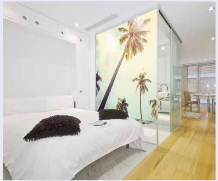
Schlafen unter Palmen – hier träumen Sie bestimmt gut. Bei diesem Anblick beginnt auch der Morgen viel entspannter.