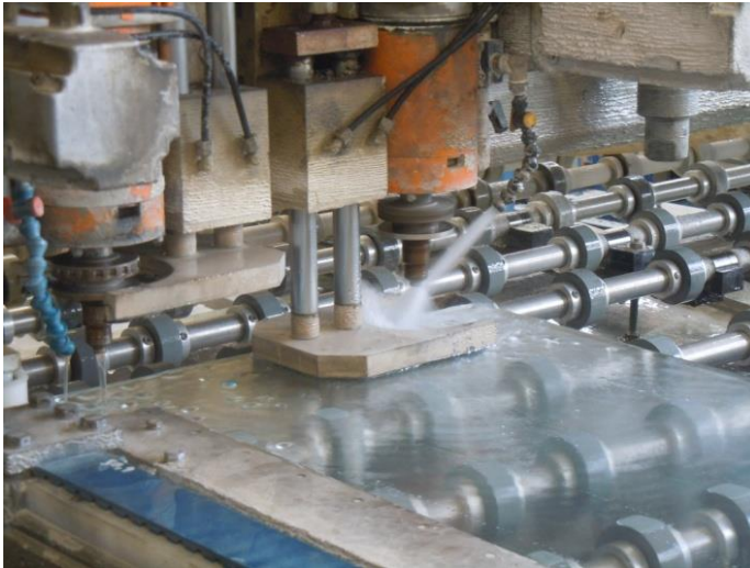
Analyse der Fertigungsmöglichkeiten